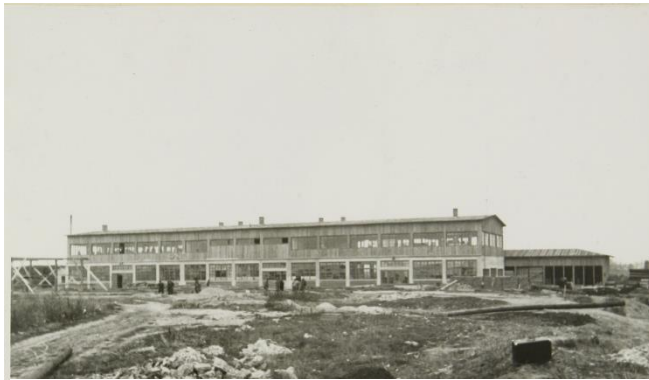
Stolárska dielňa, Zdroj: SNA

V pracovných táboroch sa výrobná činnosť realizovala v tzv. podnikoch, dielňach a pracovných skupinách. Tie sa delili na zárobkovo činné a nezárobkovo činné. Hlavným podnikom a najväčšou dielňou v seredskom tábore bola stolárska dielňa. Nachádzali sa tam aj ďalšie: hračkárska, betonárska, zámočníctvo, klampiarstvo, sústružníctvo, čalúnnictvo, výroba