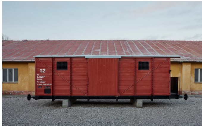
Dobytčí vagón, Foto: SNM – MŽK, Múzeum holokaustu v Seredi

Súčasťou expozície je aj autentický deportačný vagón. Bol dvakrát využitý ako súčasť transportov, ktorých cieľovou stanicou bol koncentračný a vyhladzovací tábor Auschwitz. Tieto tzv. dobytčie vagóny sa stali jedným zo symbolov tragického osudu Židov.