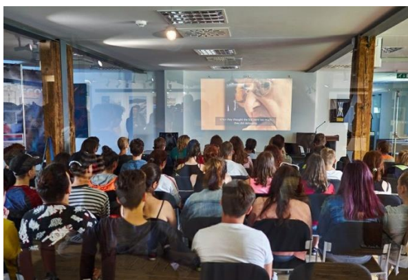
Vzdelávanie v múzeu

Súčasťou SNM – MŽK, Múzea holokaustu v Seredi je vzdelávacie stredisko, ktorého cieľom je poskytovať výchovno-vzdelávacie podujatia, semináre a školenia zamerané na oboznamovanie pedagógov, žiakov, študentov a širokej verejnosti s dopadom holokaustu na život Židov na Slovensku a v Európe. Prostredníctvom vzdelávacích aktivít sa snažíme osloviť základné školy, stredné