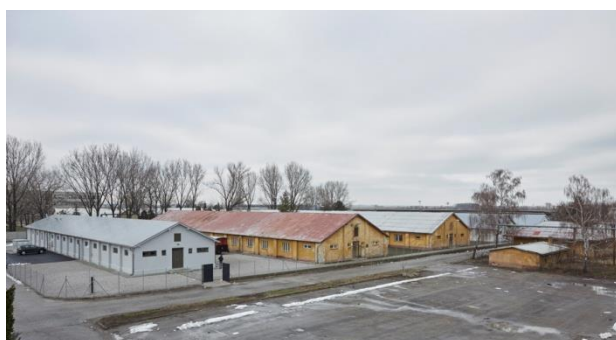
Súčasný pohľad na miesto bývalého appellplatzu