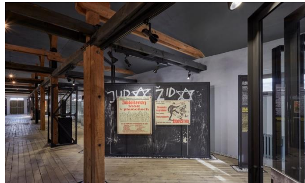
Expozícia č. 1

Expozícia číslo 1 je venovaná „riešeniu židovskej otázky“ na území Slovenska v rokoch 1938 až 1945. Slovenský štát systematicky prenasledoval svojich občanov židovského pôvodu. Veľkoplošné fotografie poukazujú na postupný proces vyčleňovania židovskej menšiny zo všetkých oblastí života. Ukážky dobovej tlače dokumentujú protižidovskú propagandu. Slovenská vláda vypravila od 25. marca 1942 do 20. októbra 1942 za hranice Slovenska 57 transportov a v nich 57 752 Židov. 19 transportov smerovalo do Auschwitzu, zvyšných 38 do oblasti v okolí mesta Lublin.